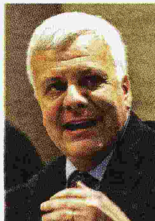
Il ministro Gian Luca Galletti

Una famiglia milanese in piazza Gae Aulenti. Con la prima pioggia del 2016 si sono ridotte le polveri sottili e gli inquinanti da smog anche nel centro di Milano