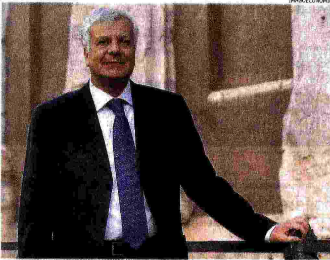
Ministro dell'Ambiente. Gian Luca Galletti